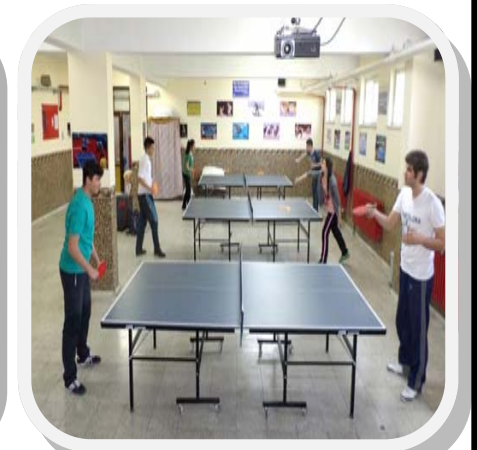
SEYYİT MAHMUT HAYRANİ ANADOLU LİSESİ ÖĞRENCİLERİ TATİLDE SPORU TERCİH ETTİ