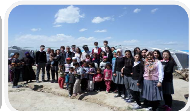
İLÇEMİZDE YAŞAYAN SURIYELİLERİ ZİYARET ETTİK