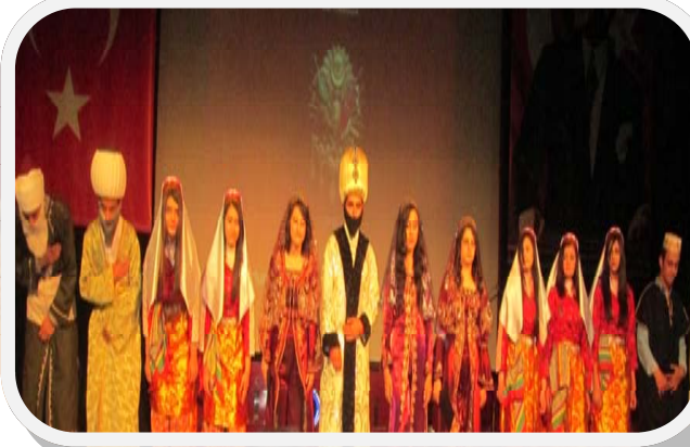
ASMAHAL Öğrencileri Tarafından Hazırlanan Fetih Programı