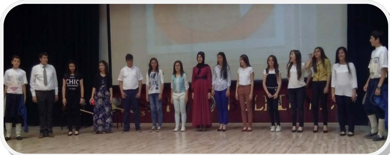
ASMAHAL' dan Şiir ve Türkü Gecesi AKM'de yapılan şiir ve türkü gecesinde şiirler okunurken duygusal anlar yaşandı. Program türkülerle sona erdi.