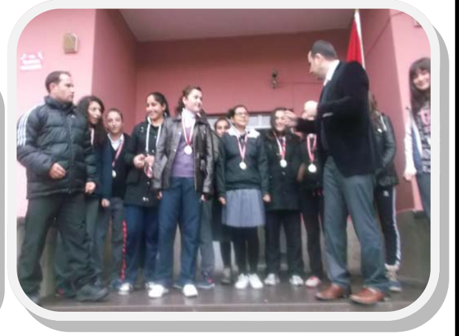
ASMAHAL KROS TAKIMI 19 MAYIS GENÇLİK HAFTASI TURNUVALARINDA HEM KIZLARDA HEM ERKEKLERDE TAKIM HALİNDE İLÇE İKİNCİSİ OLDU. ÖDÜL DAĞITIM TÖRENİNDE 8 ADET KUPAYLA OKULUMUZA DÖNDÜK. BAŞARILI OLAN ÖĞRENCİLER OKUL YÖNETİMİ, TARAFINDAN ÖDÜLLENDİRİLDİ.