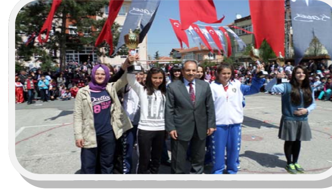
ASMAHAL Öğrencileri kros takımı takım olarak kızlarda Akşehir Birincisi, Erkekler de takım olarak Akşehir üçüncüsü oldu.