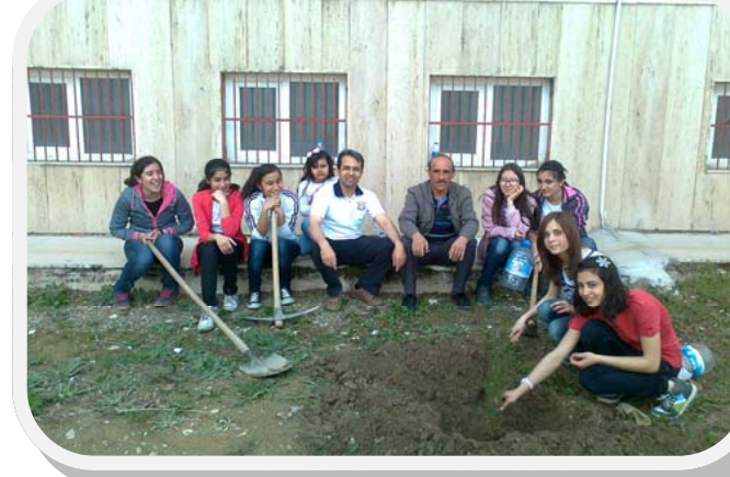
OKUL BAHÇESİNE FİDAN DİKİMİ