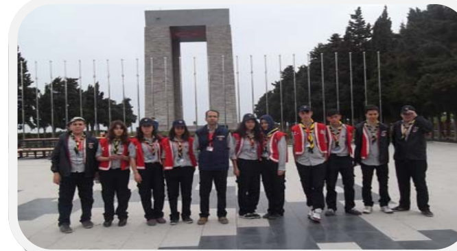
ÇANAKKALE MİLLİ BİLİNÇ KAMPI