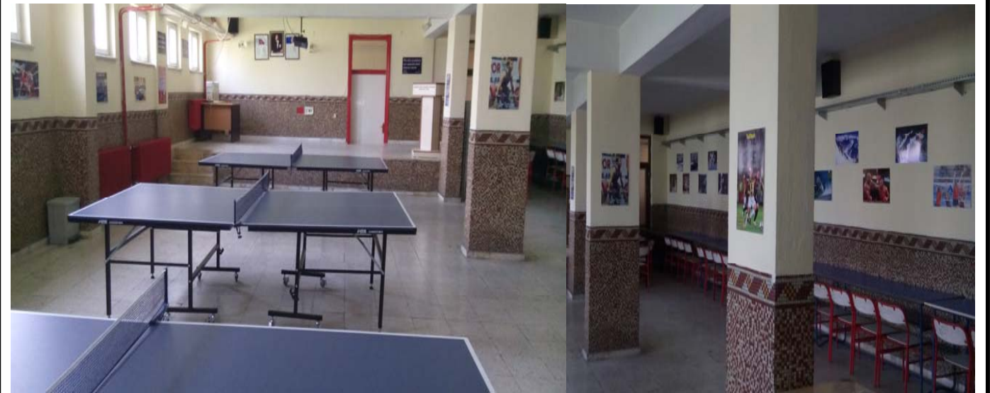
ÇOK AMAÇLI SALONUMUZ