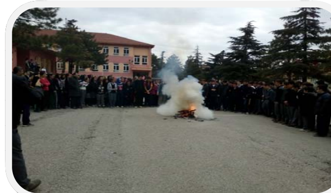
ASMAHAL'DA SİVİL SAVUNMA TATBİKATI