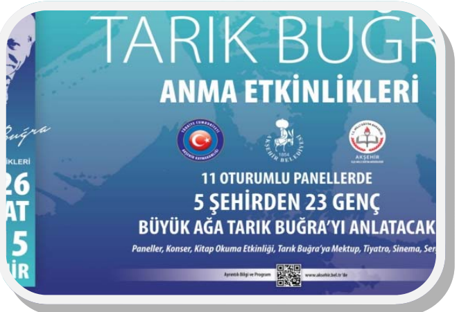
Öğrencilerimiz Tarık Buğra panelini dinlemek amacıyla Akşehir Kültür Merkezine gitti.