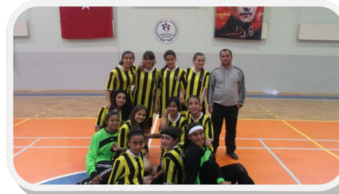
ASMAHAL KIZ FUTSAL TAKIMI AKŞEHİR BİRİNCİSİ OLDU