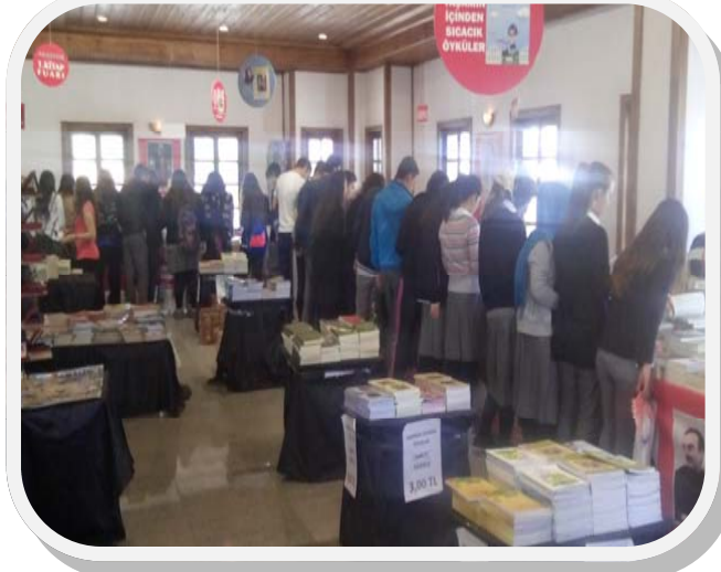
Öğrencilerimizle Kitap Fuarını Ziyaret Ettik